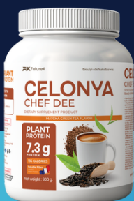
CELONYA PROTEIN (ເຮລອນ) 900 G