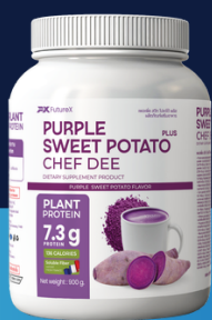
PURPLE SWEET POTATO PROTEIN (ມັນຈວງ ໂປຣຕິນ) 900 g